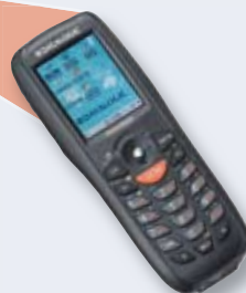
Mobile Stellplatzverwaltung. Beispiel für Hauptmenü auf dem MDE