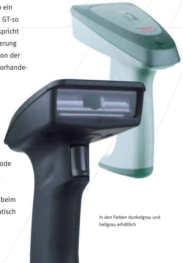
In den Farben dunkelgrau und hellgrau erhältlich